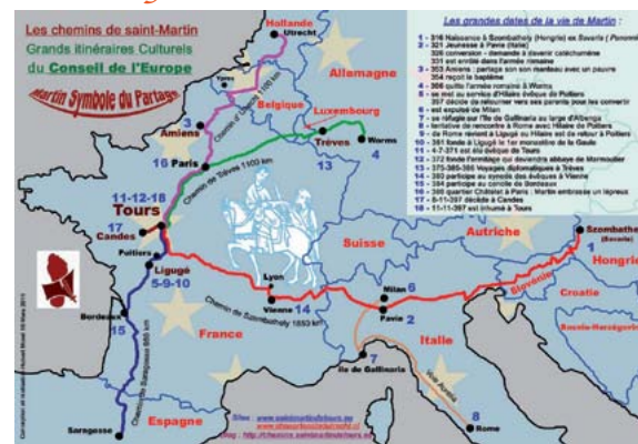
Via Sancti Martini Roanne-Vichy

Les actions de notre structure (SM MM) concernant ce dossier ont débuté au printemps 2015. Un partenariat a alors été établi avec le Centre Culturel Européen St Martin de Tours qui dirige le programme à échelle européenne.