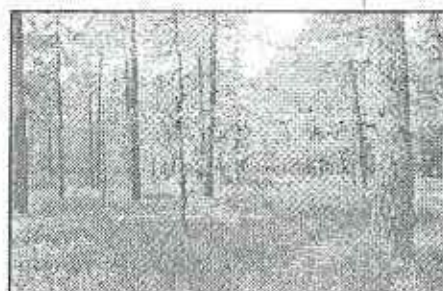
Tourbière boisée, (U5) Habitat prioritaire

3) De même, la chauve-souris baptisée Barbastelle ( Barbastella barbastellus ) observée notamment dans la vallée de la Credoigne sera l'objet de toutes les attentions. En effet, cette espèce est particulièrement rare et sa présence remarquable.