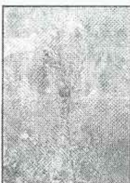
Camarine noire

Chaque unité fait l'objet d'une gestion particulière. (Voir tableau 1 et 2)