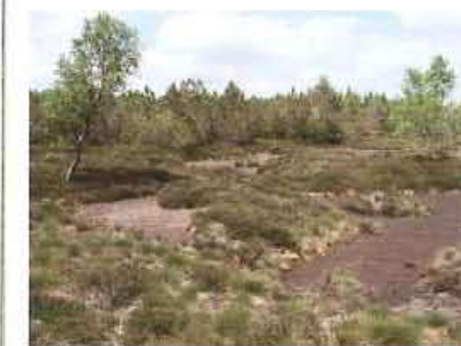
Tourbière des Narces, St-Nicolas-des-Biefs (ONF)