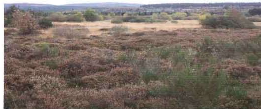
Landes sèches européennes et prairie à molinie – Plateau de la Verrerie – APCPNRMM