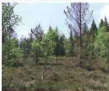
Tourbière du Mépart (Laprugne) — ONF

Ces contrats devraient être signés courant 2010.